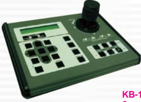
KB-100 Compact Size PTZ Control